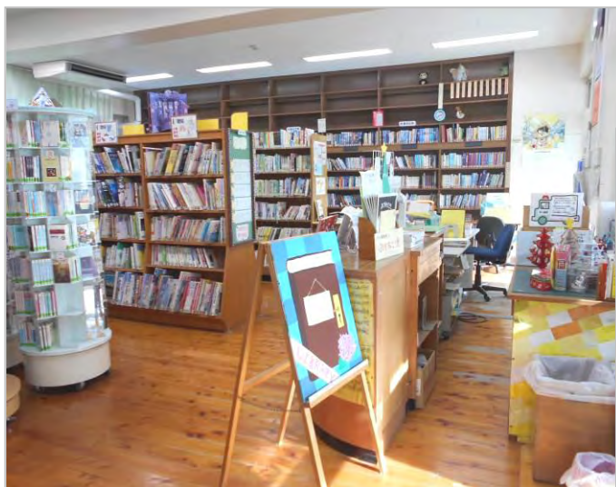
◀▼第三中学校図書室の様子と 展示コーナー

市立小・中学校図書館では、様々な本に接する機会や興味をもってもらうために、全校でその時々 の出来事や季節に合ったテーマの本を集めて展示を行っています。