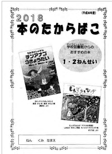
▲「本のたからばこ」（小学校）

市立小・中学校図書館では、ブックリスト「本のたからばこ」（小学校）・「ほんとのであい」（中学校）を作成し、おすすめの本を紹介しています。また、児童・生徒や保護者の読書への関心を高める広報活動として、図書館だよりを発行しています。