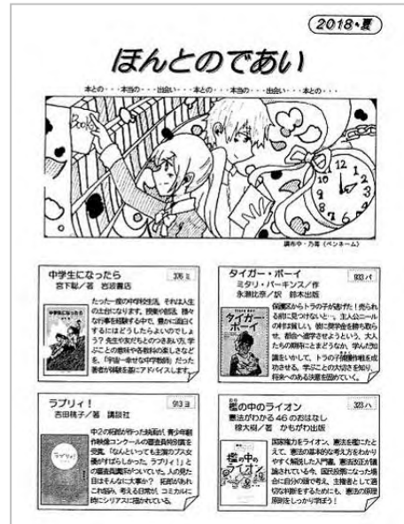
▲「ほんとのであい」（中学校）