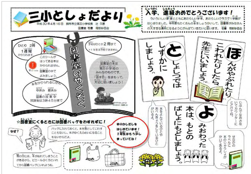
▲三小としよだより