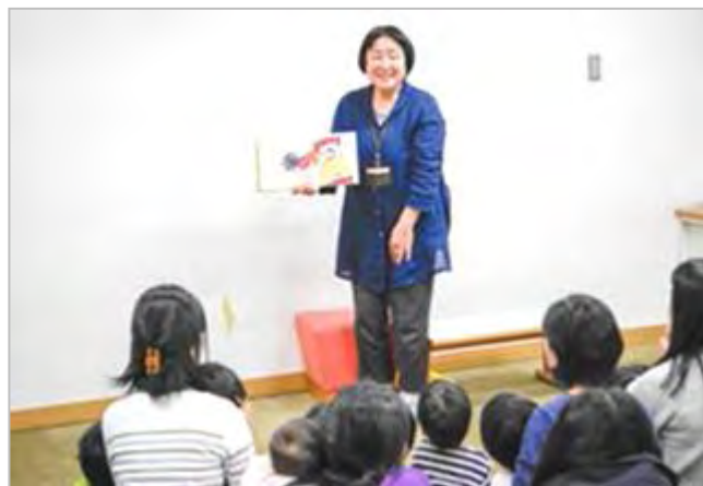
▲中央図書館 0・1・2歳児対象のおはなし会