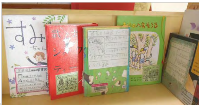
◀国領小学校図書室の展示コーナー （教師・児童の推薦文付資料の展示）