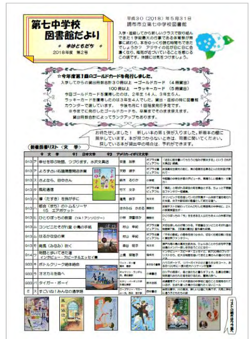
▲第七中学校図書館だより