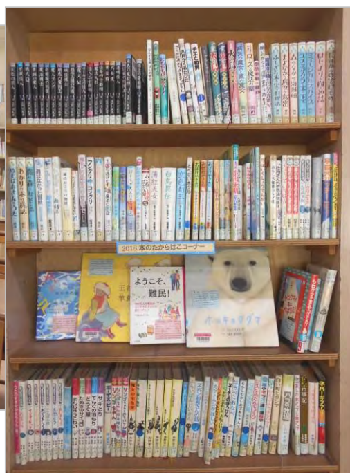
▲国領小学校図書室の展示コーナー （本のたからばこ）